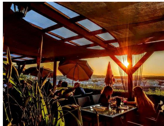
Distelfarm im Sommer

Einkehr: Distelfarm (Nähe Robert – Bosch – Krankenhaus)